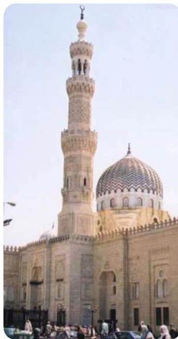
مقام حضرت زینب در مصر

تجربه کردند. ۱ مقریزی در مورد سوگواری مصریان برای امام حسین علیه السلام چنین گزارش می‌دهد: «اداره‌های دولتی و مغازه‌ها و محل‌های تجارت، سه روز مانده به عاشورا تعطیل می‌شد و فقط ناوایی‌ها به فعالیت می‌پرداختند.» ۲