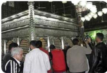
ضریح رأس الحسین در قاهره

د- تشکیل مجالس برای یادگیری علوم اهل بیت (علیهم السلام) ۴