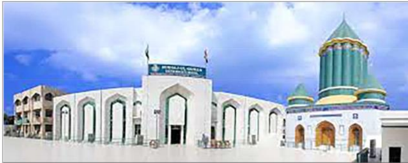
مؤسسه منهج القرآن در لاهور

علاوه بر این حجم از فعالیت، طاهر القادری مؤسس یکی از بزرگ‌ترین احزاب سیاسی پاکستان به نام حزب «عوامی تحریک» است که از افت‌وخیزهای بسیاری برخوردار بوده است.