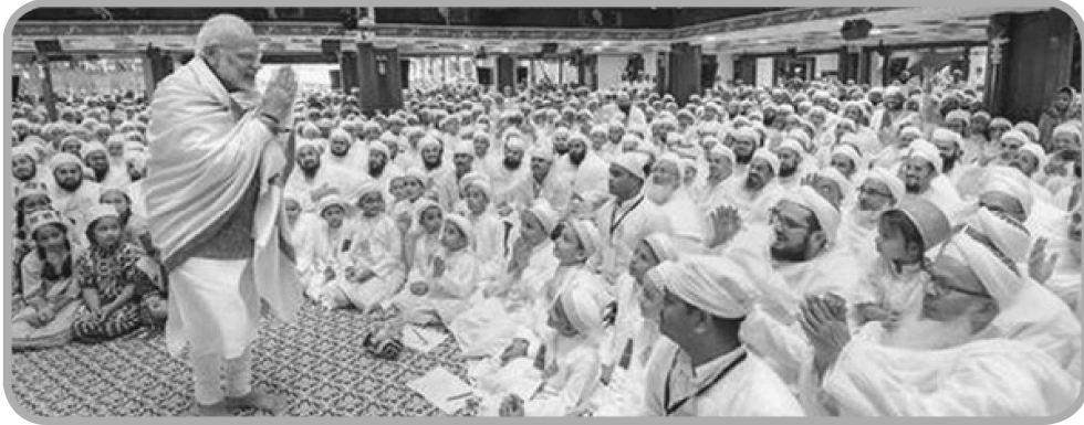
نخست وزیر هند در جمع شیعیان بهره به مناسبت ایام عزاداری امام حسین (علیه السلام)

امروزه در مؤسسات غربی بیش از اینکه به رهبری توجه کنند به مدیریت می‌پردازند و در این زمینه نیز موفق بوده‌اند اما به این نتیجه نیز رسیده‌اند که برای توسعه ظرفیت نیروی انسانی وجود رهبرانی قوی و رهبرسازی بسیار ضروری می‌باشد. در یک موسسه یا جامعه، داشتن رهبری قوی با مدیریت ضعیف کارساز نیست و می‌تواند شرایطی ایجاد کند که از حالت عکس آن بسیار بدتر باشد؛ یعنی داشتن مدیریت قوی و رهبری ضعیف قابل قبول‌تر است. برخی از مدیران خوب هرگز نمی‌توانند رهبرانی عالی باشند و برخی دیگر با پتانسیل بسیار زیاد رهبری، به دلایل متعددی نمی‌توانند مدیرانی مؤثر و کارا باشند.