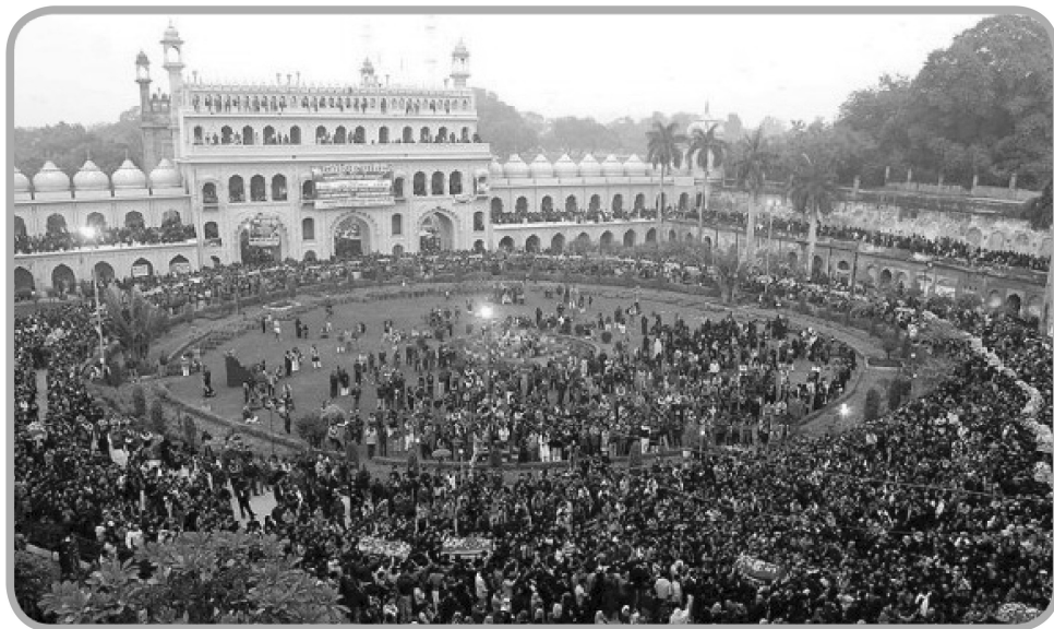
خاکسپاری نمادین شهدای کربلا در لکنهو

نویسنده که معلوم است سال‌ها در شهر لکنهو می‌زیسته، برای تحریر بخش اول کتاب خود از منابع مهم این دوره که اکثر آنها از فارسی و اردو به زبان انگلیسی ترجمه شده استفاده کرده است. بدین خاطر است که باید توجه داشت برخی تفاوت‌های رفتاری یا عقیدتی میان اهل سنت و شیعیان که توسط نویسنده ذکر می‌شود معطوف به جامعه لکنهو است نه تمام شیعیان در سراسر دنیا؛ به عنوان مثال هالیستر در خصوص نماز