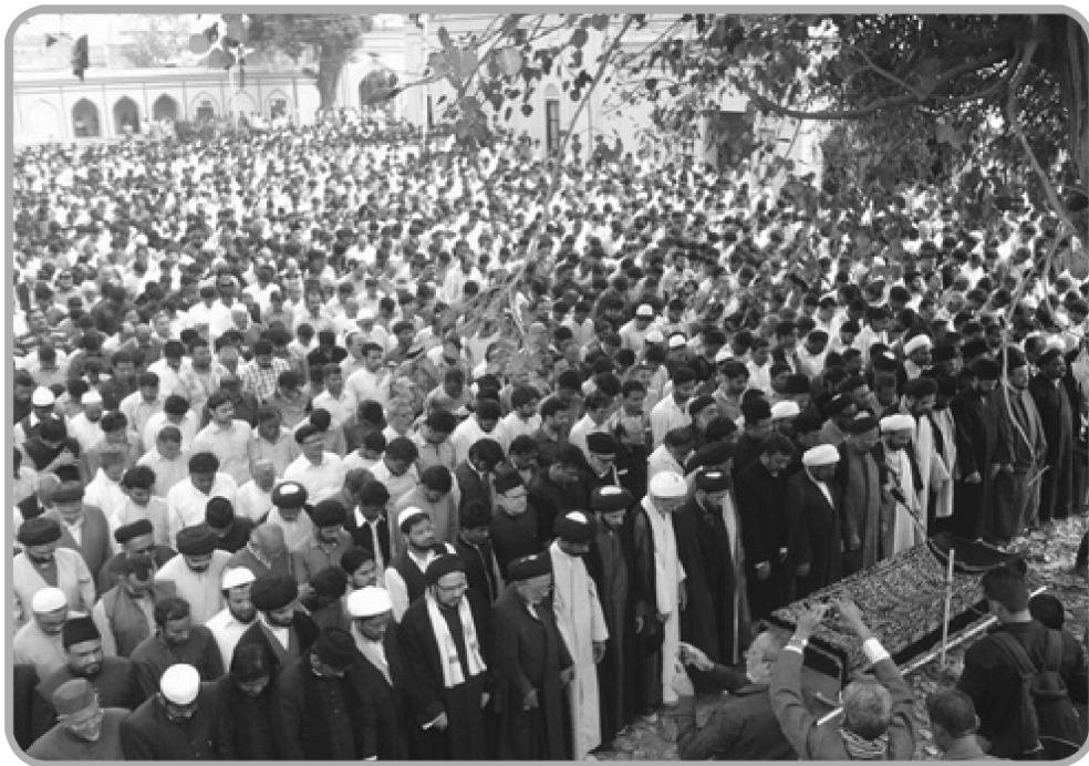
تشییع خطیب اکبر هندوستان در لکنهو

یک اصولی وقتی رأی و وجدان حکم کند که فتوای مجتهد بر خلاف احکام نازل شده یا فطری یا عدالت و عقل است خود را مقید به پیروی از آن نمی‌داند. اصولیون به احادیث فراوانی که بدون درایت و انطباق با